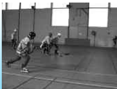
Hockey sur bois, les marches du palet.