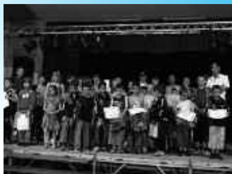
Élite sportive, les as.