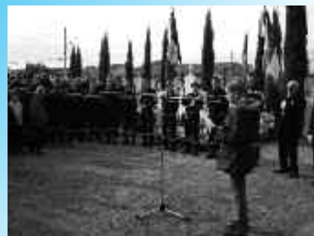
Hommage et respect