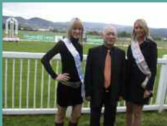
Trophée vert, un homme heureux.