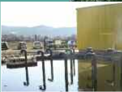
L'eau , désormais une affaire de régie.