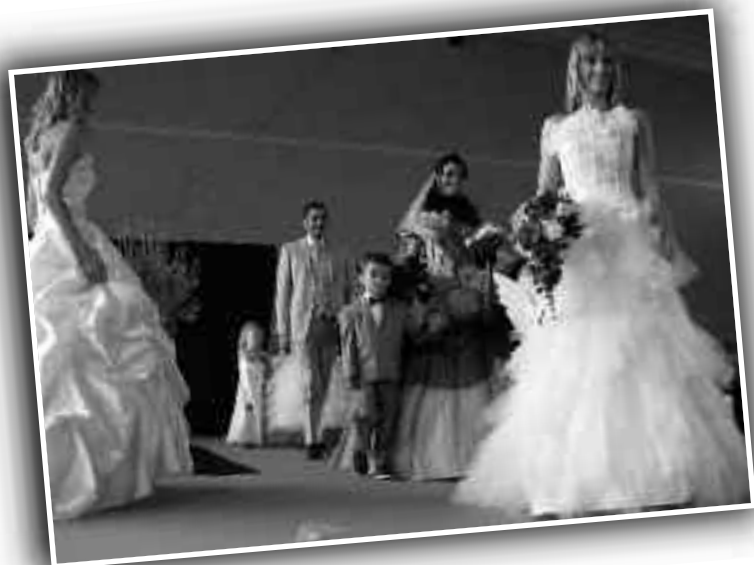
Il n'y pas d'âge pour s'aimer

La ville respire au rythme du cœur de ceux qui la font vivre et nous nous félicitons d'un tel déploiement d'énergies créatrices. Il se passe toujours quelque chose à Oraison, notre ville à la campagne, et encore une fois, il nous sera impossible de faire apparaître toutes les activités du semestre. Le sport, la culture, l'économie se conjuguent en harmonie et traversent les saisons en laissant la trace indélébile de leur passage. Ils font notre fierté et notre plaisir d'accueillir sans cesse de nouvelles idées.