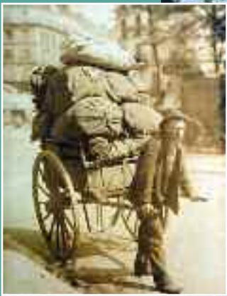
Gros plan sur les vides greniers