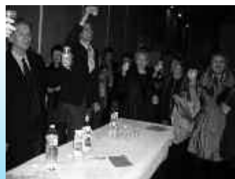
Journée de la femme