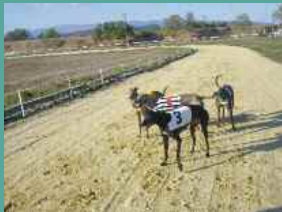
Lévriers, des chiens d'arrêt.