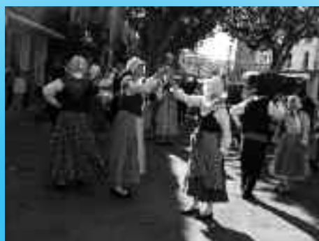
Les fileuses de fil en aiguille