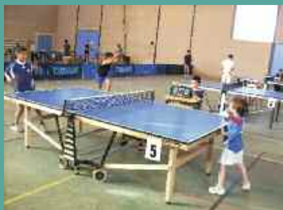
Ping pong poun.