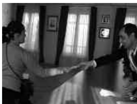
Ma première carte d'électeur