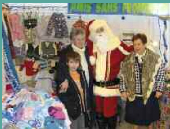
Amis sans frontière, pour le marché de Noël.