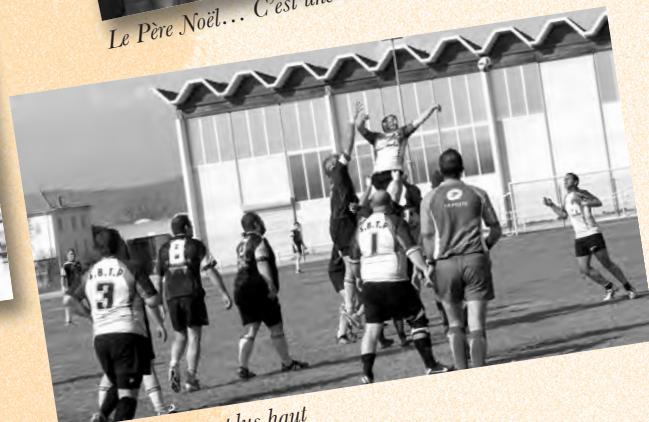
Le REP toujours plus haut