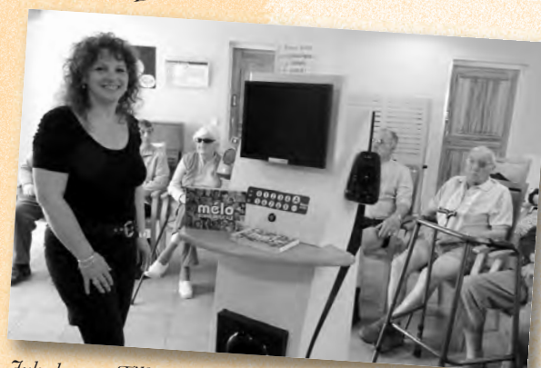
Juke box au Tilleuls