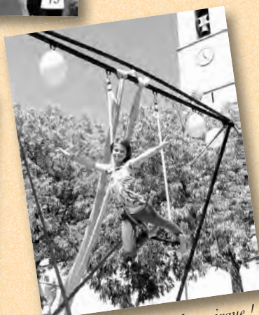
Même les anges font leur cirque !