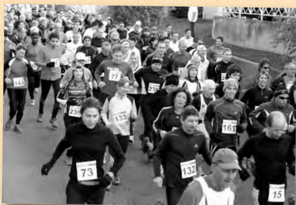
La foulée toujours aussi populaire !