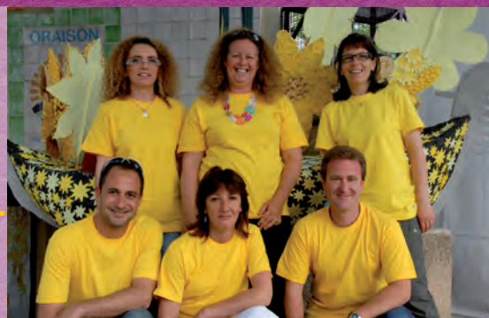
Plus jaune était le CMJ