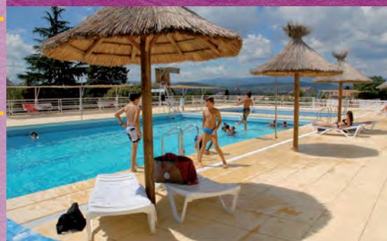
La piscine d'Oraison, c'est le paradis