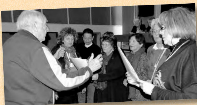
La chorale des cheveux d'argent