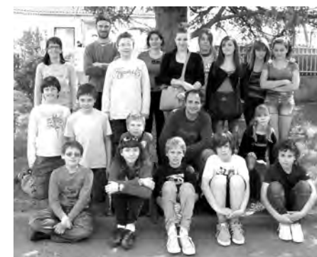
Le stage de musique

Même les adultes et les retraités ont rajouté.