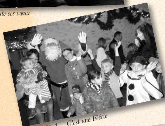
Le Père Noël... C'est une Féerie