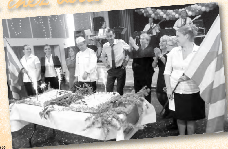
Le super gâteau du CCAS

Voici un pâle résumé d'images accompagné d'une certaine frustration de la rédaction de ne pouvoir mettre tout le monde. Notre ville à la campagne peut s'enorgueillir d'avoir « tout d'une grande » et doit rester un lieu où il fait bon vivre. Il en va de la responsabilité de chacun. Impliquez-vous dans la vie associative, participez aux animations proposées car, en donnant un peu de vous-mêmes, vous aurez en retour de belles récompenses humaines et une cité encore plus vivante.