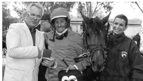
Les félicitations au vainqueur

Plusieurs courses hippiques étaient programmées durant cette journée, aussi bien au trot qu'au galop, sans oublier, en fin de réunion, deux courses de lévriers sur la piste en sable, organisées par la société azuréenne de courses de lévriers.