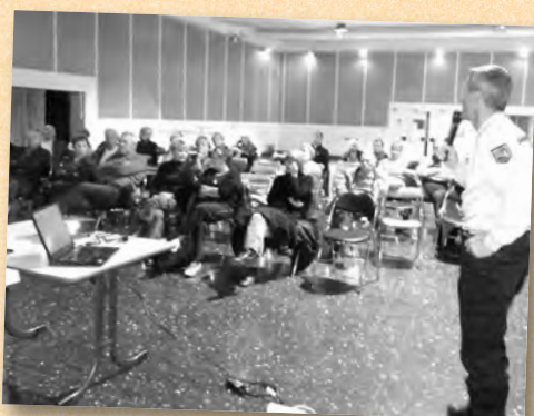
Une conférence sur la sécurité