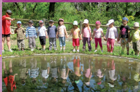
Les reflets de la maternelle