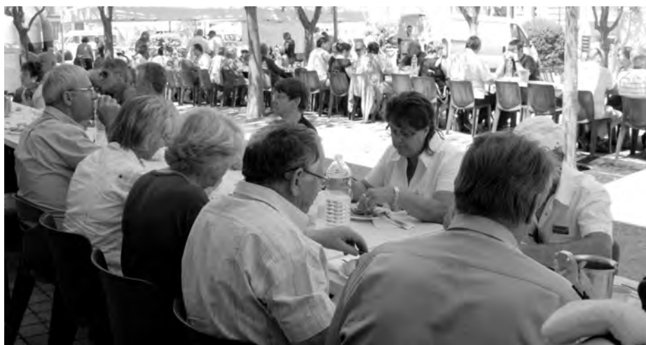
Le jaune se fête à l'ombre des arbres