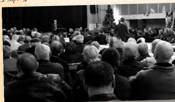
Le maire présente ses vœux