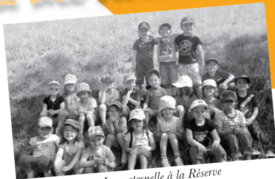
La maternelle à la Réserve