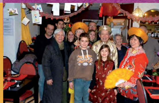
Nouvel an chinois à Oraison