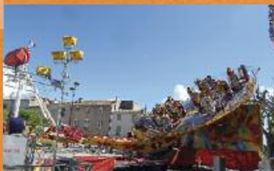
Tournez manèges !