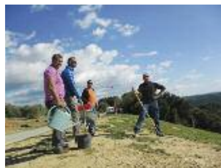
L'entretien de l'aire d'envol

Après une courte trêve hivernale (assemblée générale et séance de sécurité) les vols ont vite repris. Le club connaît un certain succès et le bureau se trouve confirmé dans ses objectifs d'harmonisation et d'ouverture sur la vie oraisonnaise. Chaque mois plusieurs néophytes découvrent le vol biplace associatif avec le club. De belles ballades aériennes ont déjà été réalisées depuis notre décollage, jusqu'à La Brillanne, Volx, Valensole, St Auban ou Gréoux. L'entretien de l'aire d'envol est bien avancé : ratissage, récolte de déchets, révision de la balise météo et jardinage aussi... Le club réfléchit pour améliorer la convivialité de ce lieu public. Nous préparons une belle fête de club pour le week-end end du 13 septembre. À bientôt.