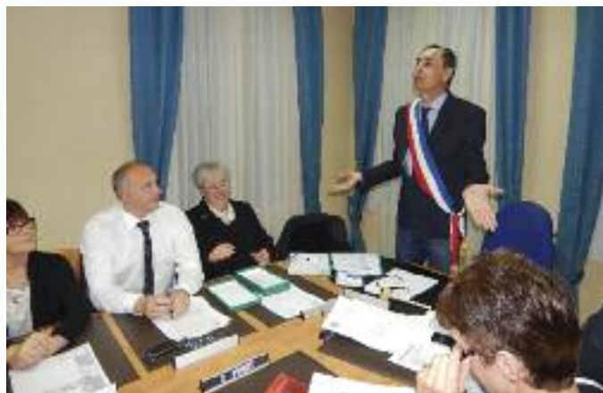
Le maire réélu