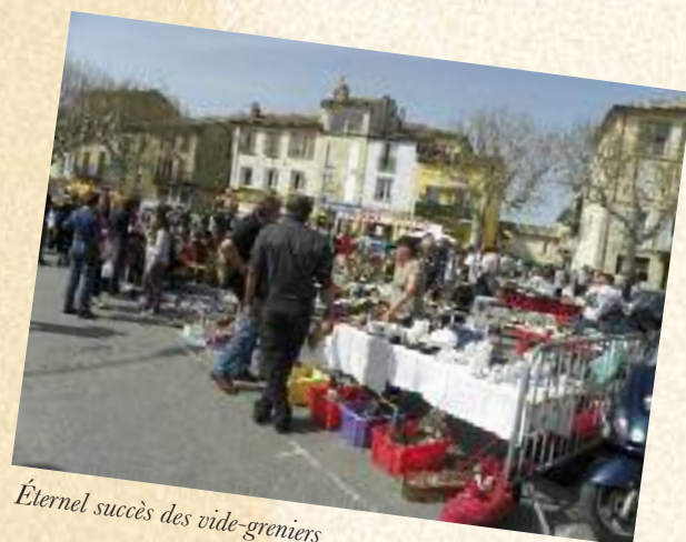
Éternel succès des vide-greniers