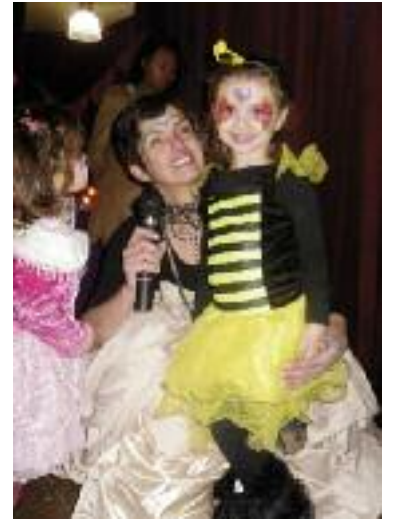
La reine du carnaval

L'association Destination Jeunesse a organisé de nombreuses manifestations comme Halloween, le Carnaval, son vide-grenier, a participé à Plus Jeune Ma Ville avec démonstration de danses country et des informations vers les jeunes. Fin juin le Hip Hop s'était invité à l'Eden, nous y reviendrons. A noter le 16 octobre prochain, le 6 e forum des métiers de la Défense et de la Sécurité sur les places du centre-ville et dans les salles du château. Seront présents l'armée de terre et de l'air, la marine, les chasseurs alpins de Gap, la police nationale, la gendarmerie nationale, le service pénitentiaire du 04/05, le service des douanes, le service de santé des armées, le mur d'escalade d'Annecy, les sapeurs pompiers, la mission locale de Manosque, de nombreux CIRFA, la Légion étrangère, les Spahis, la réserve citoyenne etc. Destination Jeunesse vous dirigera vers les recruteurs qui vous renseigneront sur les nombreuses opportunités de carrière. Enfin, le 31 octobre, notre chère fête d'Halloween. Avant tout cela, belles vacances à tous et à très bientôt.