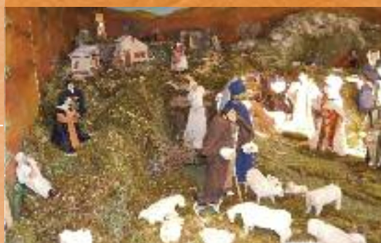
Quand les lavoirs abritent des crèches

Noël - Du 1 er au 30 décembre les crèches seront dans les lavoirs et la Féerie au château. La Table des 13 desserts sera dans les locaux des fileuses. Le Père Noël paradera le 13 et le 20 à 16h. Le marché de Noël sera ouvert les 20 et 21.