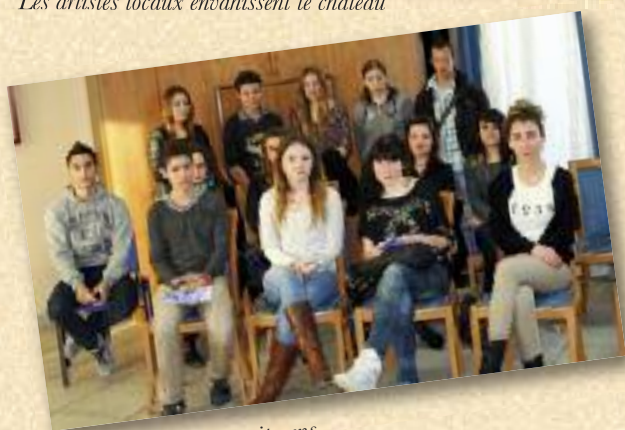
Les nouveaux jeunes citoyens