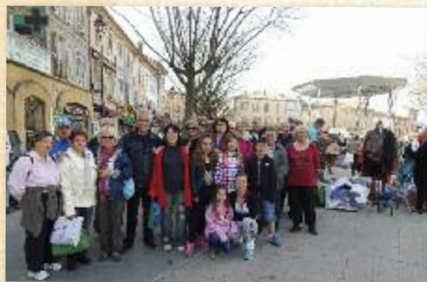
Un parcours qui a du coeur