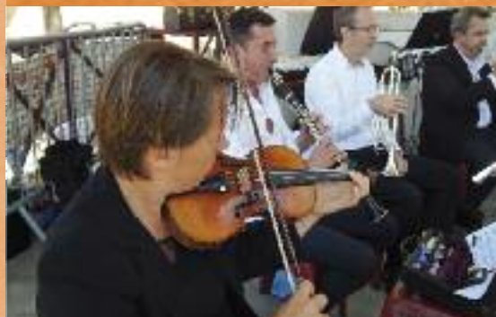
Mélodieux et harmonieux festival