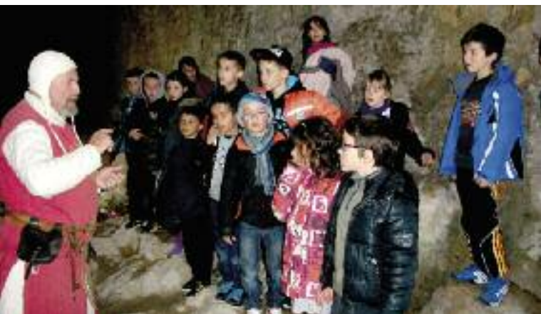
Les énigmes du château de la Barben

Pendant les vacances d'hiver, tandis que les adolescents participaient à des jeux d'intérieur, le centre des 6/11 ans s'était transformé en château fort grâce à la récupération des décors du carnaval. Fresques, tournoi de jeu de paume, bal et sortie au château de la Barben pour un jeu d'énigmes qui a bien occupé nos princesses et chevaliers. Ensuite, ce