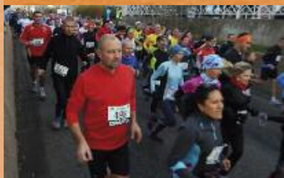
La foulée de Noël brave le froid et sacre ses champions