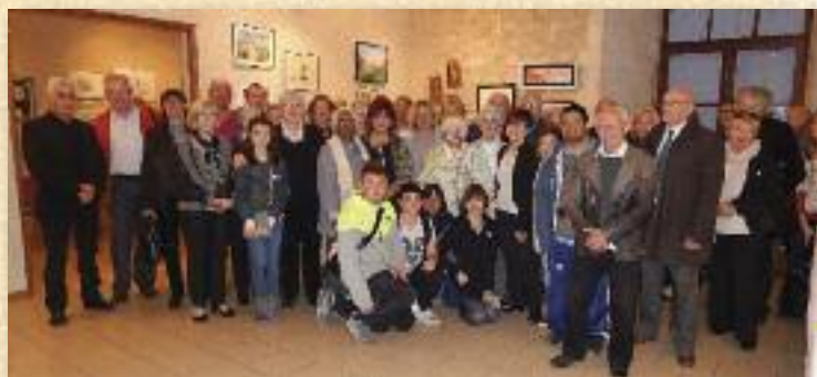
Les artistes locaux envahissent le château