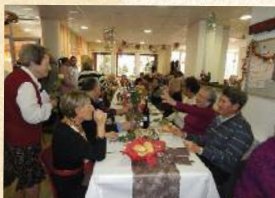
Noël aux Opalines