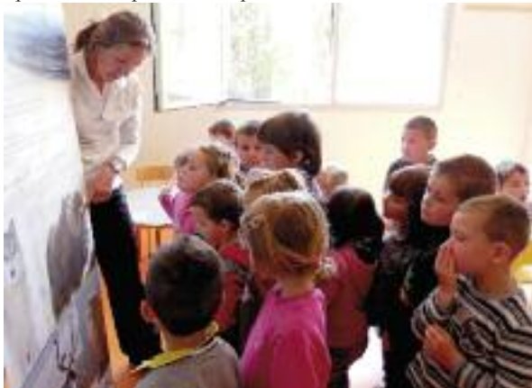
Le pôle Nord a magnétisé les enfants

Le CMJ sera ouvert du 5 juillet au 23 août. Pour y accéder, il faut avoir 11 ans, et souscrire à une adhésion de 20 ou 22€. Renseignements au CMJ (local sous la mairie) ou au 04.92.78.66.46.