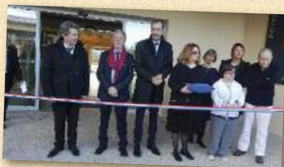
Inauguration de la résidence « Les amandiers »