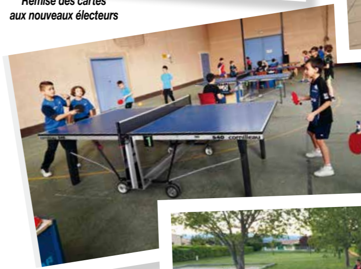
Tournoi de tennis de table