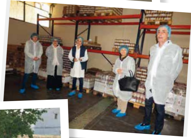
La sous-préfète visite Perlamande