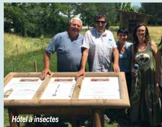
Hôtel à insectes