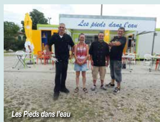
Les Pieds dans l'eau