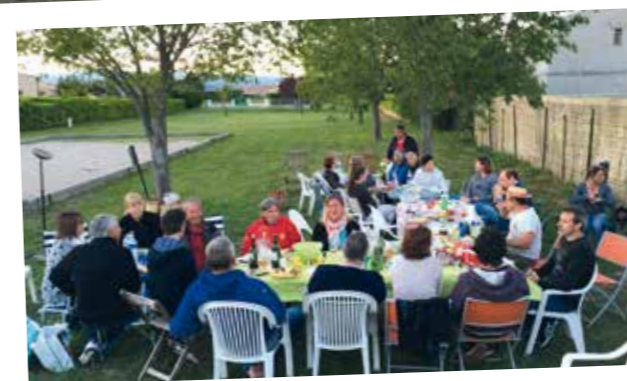
Fête des voisins à la Grande bastide

I l se passe beaucoup de choses à Oraison, et un bulletin semestriel n'y suffirait pas pour relater toutes les activités.