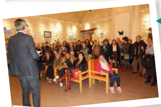
Journée de la femme