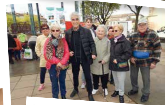
En route pour le parcours du cœur