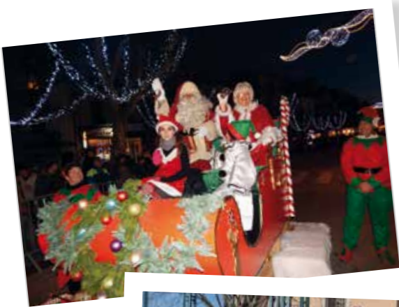
La grande parade