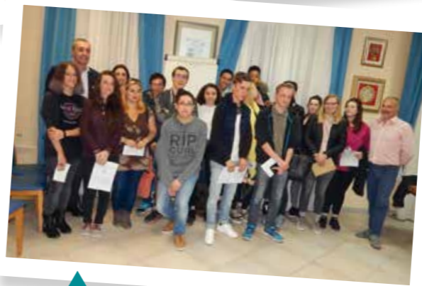
Remise des cartes aux nouveaux électeurs