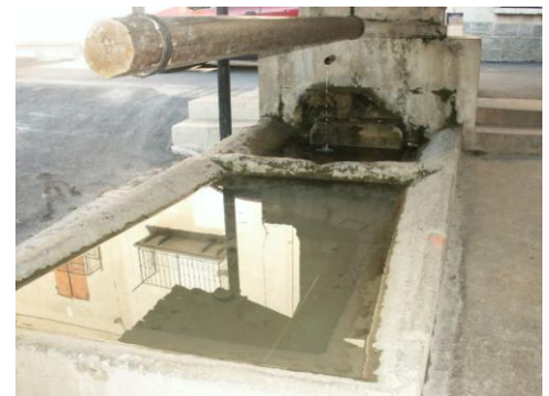
Le lavoire de la rue Joseph Latil