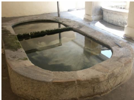
Le lavoire de la fontaine « des Pénitents »

Les ressources en eau provenant des nappes d'accompagnement peuvent couvrir les besoins en eau de 4200 personnes voire 5300 pendant la saison d'été.