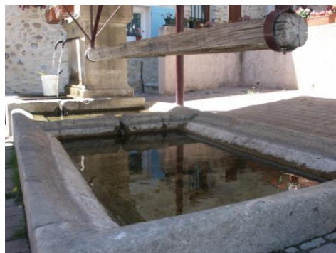
Le lavoire de la placette des Droits de l'homme