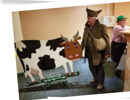
Atelier toutes danses Carnavalesque