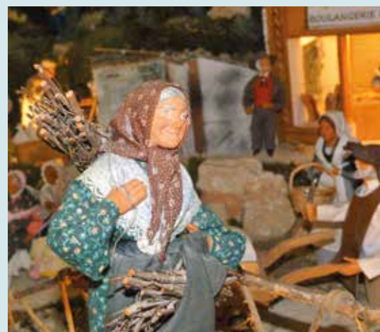
Crèches dans les lavoirs