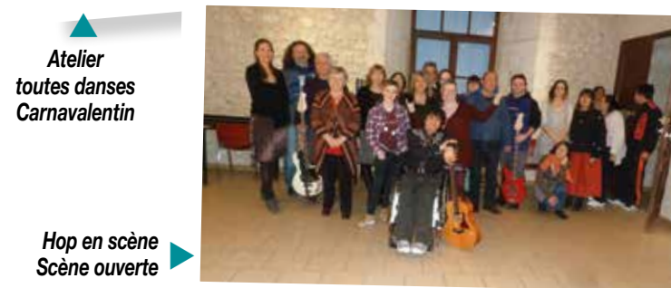
Hop en scène Scène ouverte