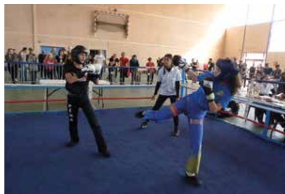
Renseignements ☎ 06 12 09 80 78 - judo.oraison@gmail.com

Les gagnants disputeront la finale à Boulogne sur mer, malheureusement sans les athlètes d'Oraison.