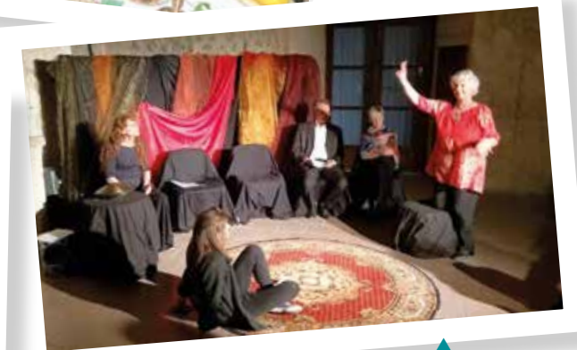
Lumière d'étoiles Printemps des poètes