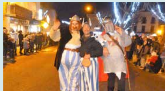
Parade de Noël