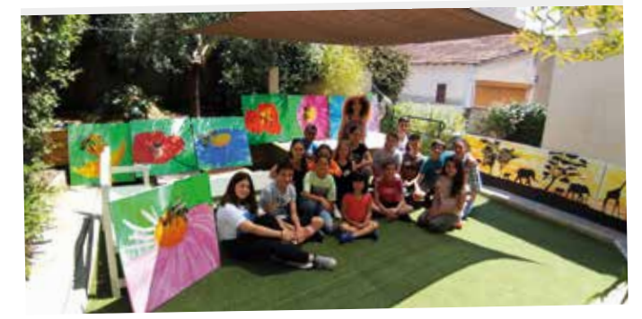
Rosario d'Espinay-Saint-Luc Printemps des Arts