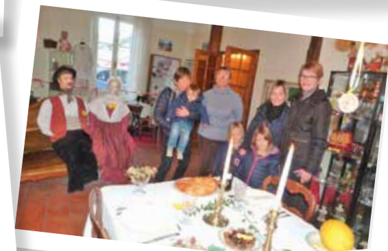
Les Fileuses Exposition des 13 desserts