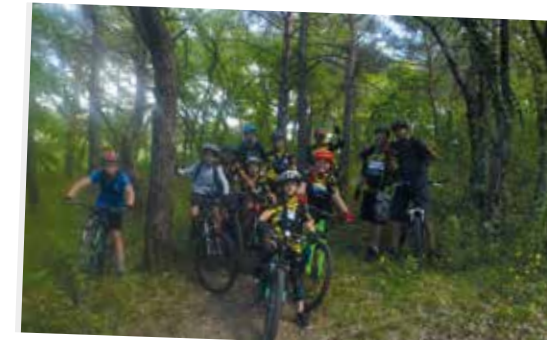
Le club VTT FFC