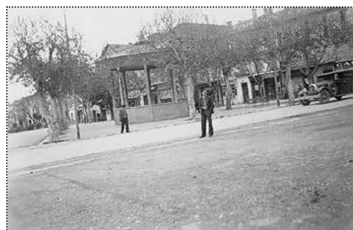
Le kiosque construit par l'entreprise Garda sous la municipalité Victor Gérard en 1925.

Le 10 décembre 1919, il est élu maire et commence une série de quatre mandats sans interruption. Il inaugure ainsi une période de soixante-quinze