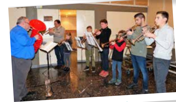
Ecole de musique - Concert de Noël