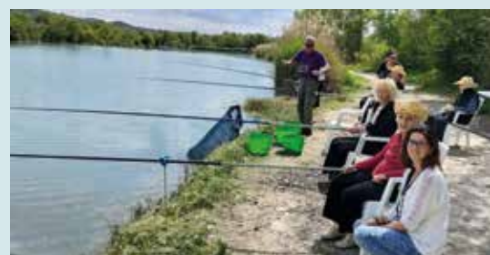
Stage de pêche avec la Gaule Oraisonnaise

Le Comité des fêtes lance un appel à figurants pour la féerie de Noël, merci de vous faire connaître à l'accueil de la mairie si vous souhaitez participer.