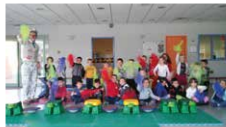
Avec le Cirque Patrick Attrack