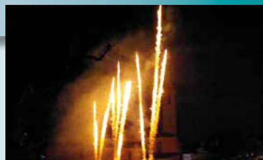
Feu d'artifice de Noël