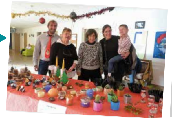
ADAPEI Marché de Noël