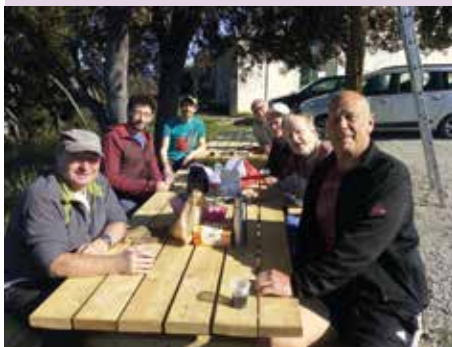
Avant le décollage les pilotes prennent des forces.