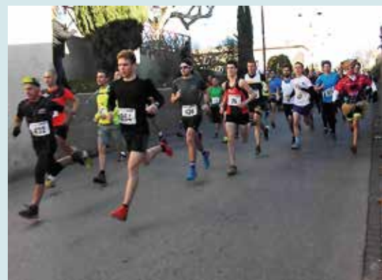
Foulée de Noël