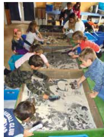
Sortie au musée de Digne