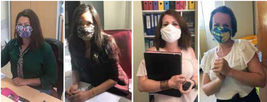
Le service accueil / état civil