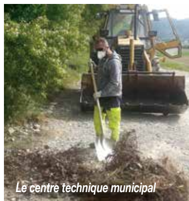
Le centre technique municipal