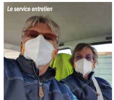
Le service entretien