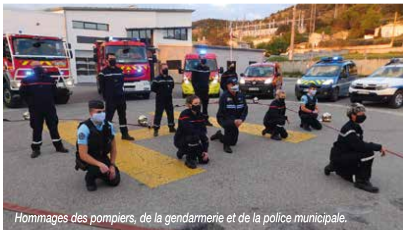
Hommages des pompiers, de la gendarmerie et de la police municipale.

Chaque soir, à 20h, les habitants de la commune se sont joints aux français en applaudissant par la fenêtre, afin de témoigner de l'immense reconnaissance envers l'ensemble des personnes dont le métier est essentiel car ils nous soignent, nous nourrissent, nous protègent et prennent soin des personnes et de notre environnement.