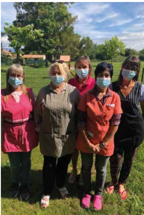
Le multi accueil municipal