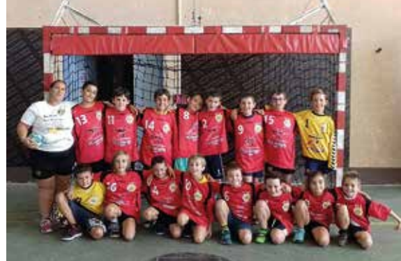
Le 11 du club, très beau collectif cette saison.