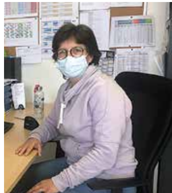
Le service jeunesse